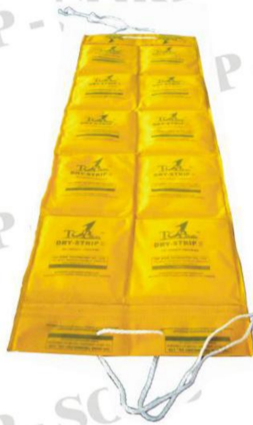
Dry Strip II-1000 (毯装设计)

Dry Insert-1000 , 吸湿基材净重1000克, 硬壳设计, 带挂钩, 印刷精美, 可大大提升客户货物的品牌形象。