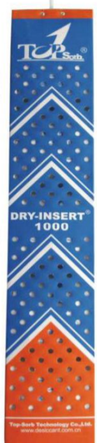
Dry Insert-1000 (精装版)

经国际权威检测机构检测, Dry Insert, Dry Strip, Dry Paste, 可持续吸湿60天以上, 吸湿率高达250%, 能持续降低相对湿度, 有效降低露点, 全航程保护货物!