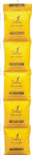
Dry Strip-1000 (平装版)