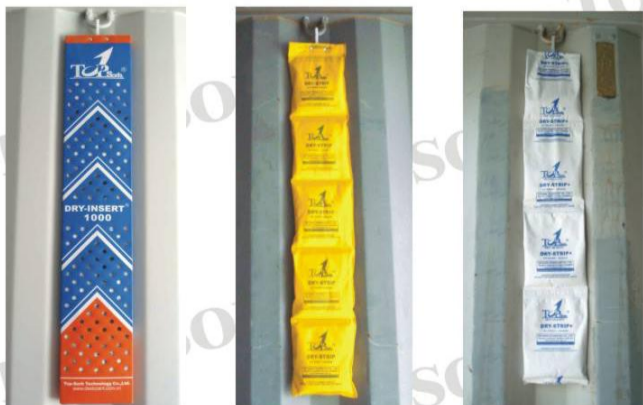
Dry Insert, Dry Strip, Dry Strip+ 可紧密嵌入集装箱壁的凹槽, 可最大限度节省装货空间!